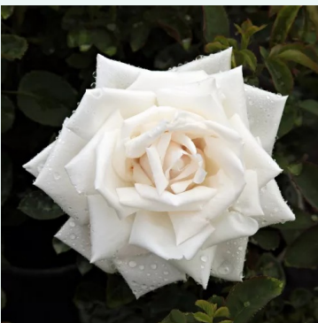
Frau Karl Druschki

rosa - historisch, chinarose 80-130 cm kräftig, lang anhaltend duftende rose - süß, rosig Johannes Felberg -Leclerc