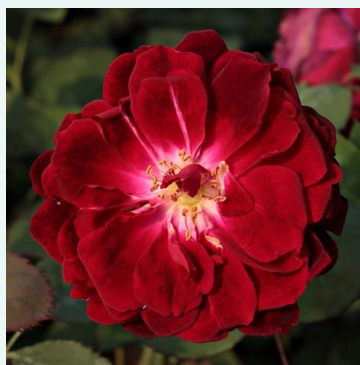
Gruss an Teplitz

gelb - historische, alte gartenrose 320-500 cm intensiv, gut wahrnehmbar duftende rose - frisch, fruchtig George Paul, Jr.