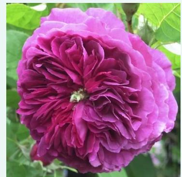
Erinnerung an Brod

karmesinrot - historische, perpetual-hybrid-rose 110-160 cm sehr intensive, den Garten erfüllende Duftrose - tief würzig-süßes aroma Bertrand Guinoisseau -Flon